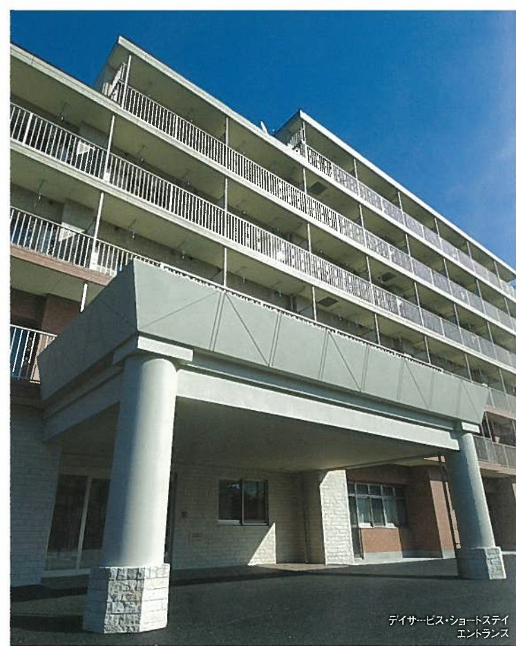
デイサービス・ショートステイ エントランス

※ふそうケアセンターのショートステイは、介護保険サービスである「短期入所生活介護」の東京都事業者指定を受けています。ご利用の際には、介護保険の要介護認定(要支援または要介護)が必要です